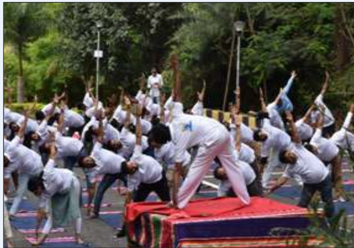
Staff and PG Scholars performing theYoga