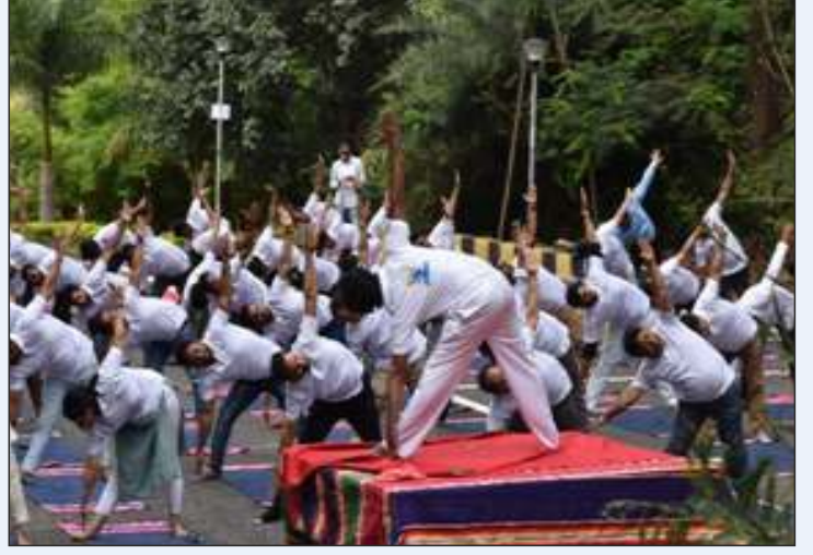
योग करते कर्मचारी और पीजी विद्वान