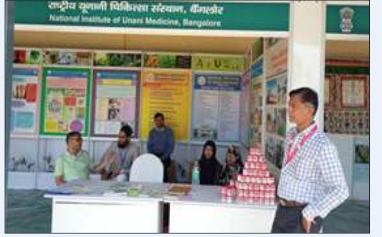
अंतर्राष्ट्रीय योग दिवस प्रदर्शनी में रा.यू.चि.सं, बेंगलूरु की भागीदारी