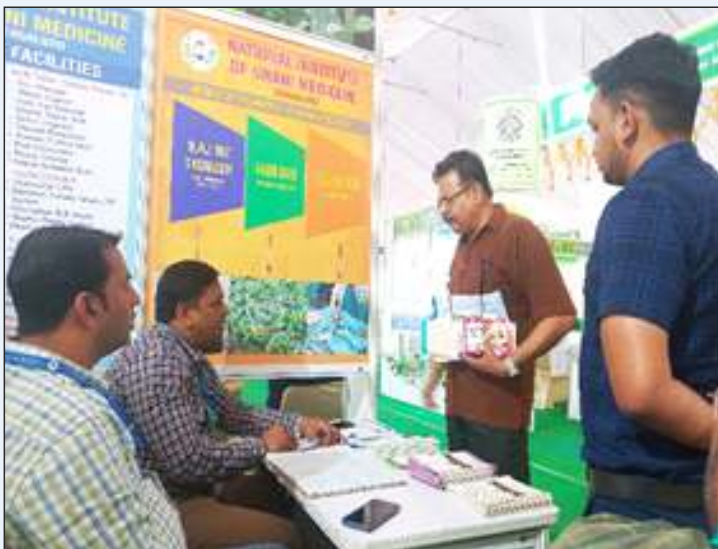
Visitors at NIUM Stall in Ujjain

National Institute of Unani Medicine deputed its faculty members and P.G. scholars to participate in the National-level Arogya fair held on May 27-30, 2022, at Kalidas Sanskrit Academy, Ujjain (M.P.). More than 1000 visitors visited the NIUM stall, where they were made aware of Unani Medicine by the faculty members and P.G. students. IEC pamphlets were also distributed to them. The Honourable President of India, Shri Ram Nath Kovind Ji, also visited the Ayush pavilion on May 29 and reviewed the activities of the Arogya fair.