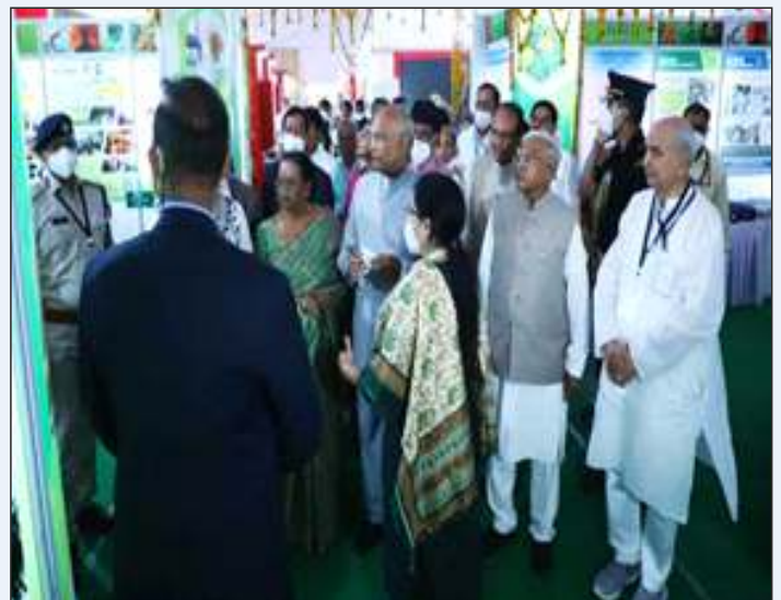
Honourable President of India at AYUSH Pavilion