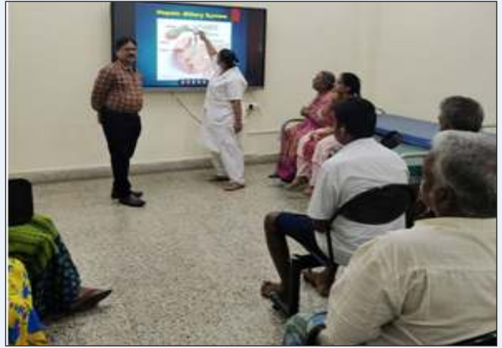
Awareness programmes under 75th Azadi ka Amrit Mahotsav