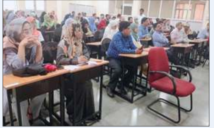
सेहत-ए-अत्फाल (बच्चों का स्वास्थ्य) के बारे में जागरूकता पर सीएमई