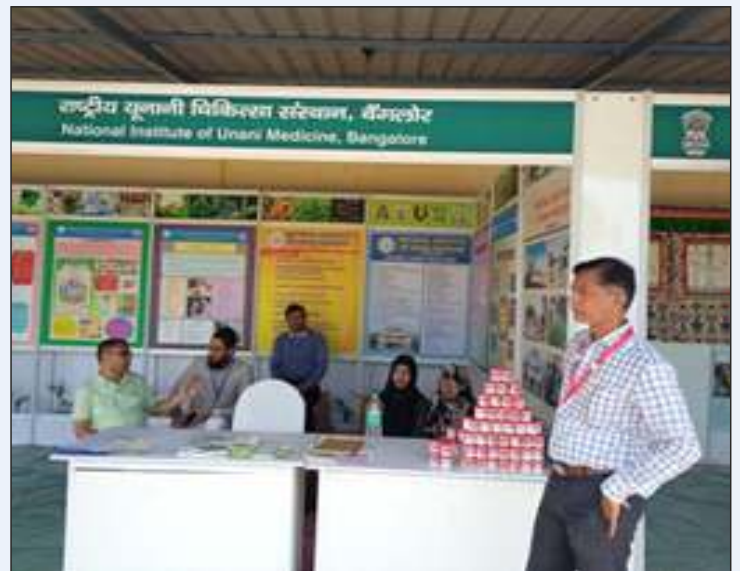
NIUM participation in IDY Exhibition