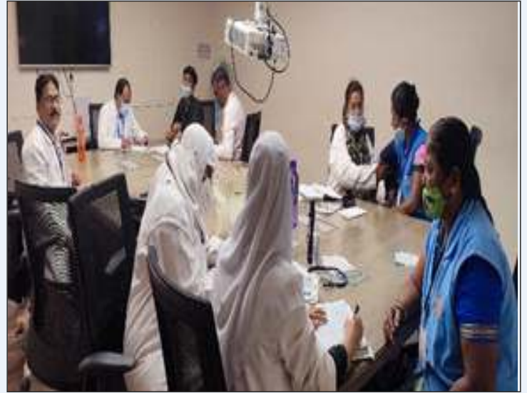
Free Swasthya Parikshan Camp at Wildcraft Factory, Bengaluru