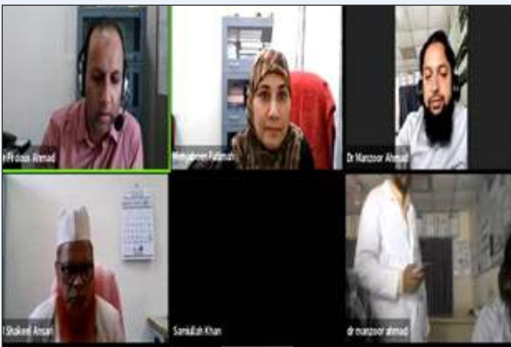
A view of Webinar