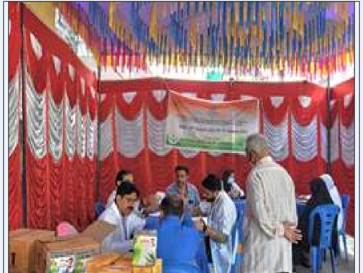
General Check-up and Unani Medicine Distribution during Camp