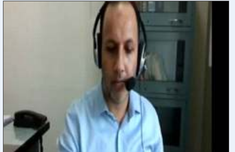
डॉ. फ़िरदौस अहमद नज़र द्वारा प्रस्तुति