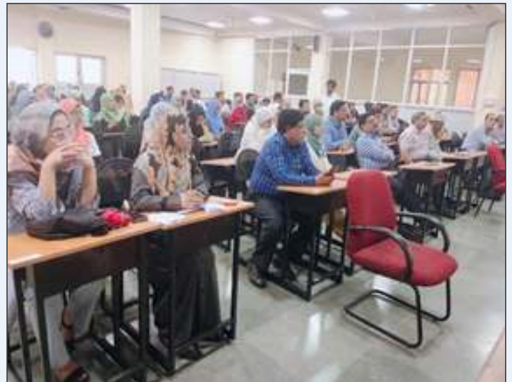
Interdisciplinary CME on Awareness of Sehat-i-Atfal (Children's health)