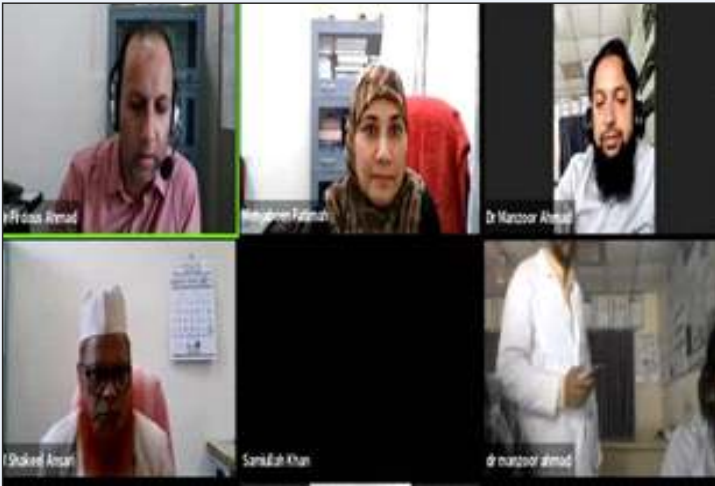
वेबिनार का एक दृश्य