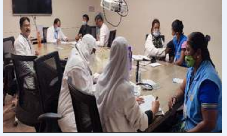
वाइल्डक्राफ्ट फैक्ट्री, सुंकदाकट्टे, बेंगलूर में निःशुल्क स्वास्थ्य परीक्षण शिविर