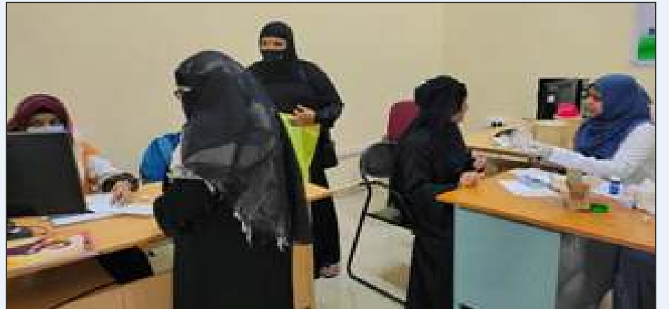
माहियतुल अमराज़ विभाग के पीजी विद्वानों द्वारा हीमोग्लोबिन का मूल्यांकन