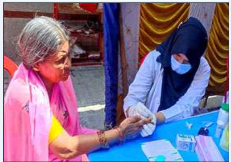
Free Swasthya Parikshan Camp and blood sugar Check-up

National Institute of Unani Medicine organized a free Unani Medical Camp under 75 Azadi ka Amrit Mahotsav on 18 th June 2022 at Tilak Nagar, Bengaluru, Karnataka. In this camp general check-up of the attendees was done and Unani prophylactic medicines were distributed among the general population.