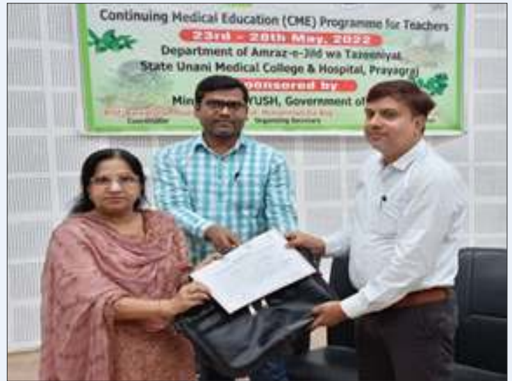
CME Jild wa Taziniyaat