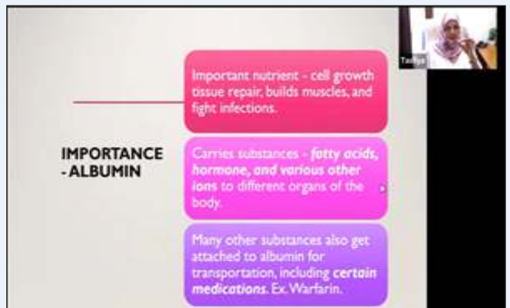
National webinar on Urine: A Diagnostic Tool