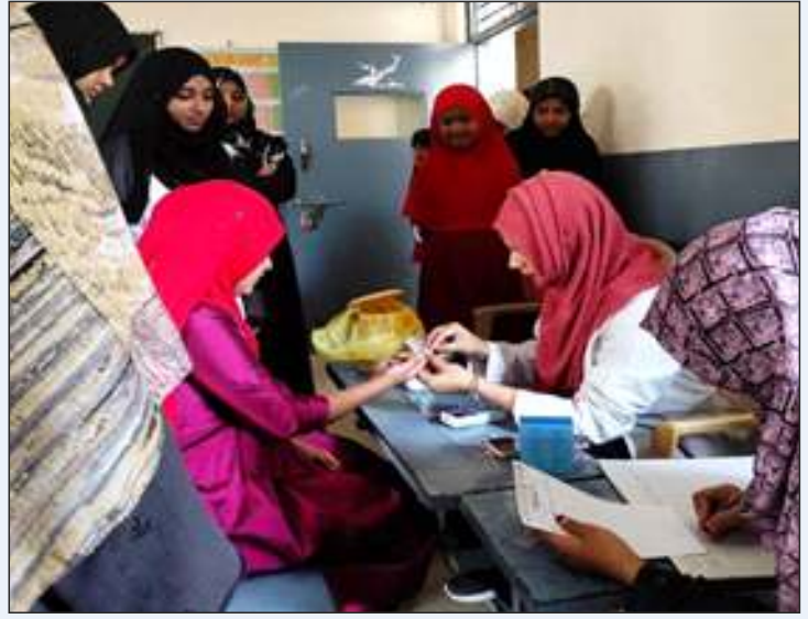
Pamphlets distribution and free haemoglobin check-up during the camp